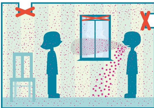
Geen ventilatie of verluchting

Volgende illustraties tonen het effect van ventileren en verluchten op het aantal microdruppels in de binnenlucht van een ruimte. Op alle illustraties zie je twee personen op een afstand meer dan 1,5 meter van elkaar. De persoon rechts is besmet met COVID-19 en praat tegen de andere persoon. Bij het praten komen geïnfecteerde druppels en microdruppels (rode bolletjes) vrij. Grotere druppels vallen snel neer omwille van hun zwaarder gewicht terwijl kleinere microdruppels lang kunnen rondzweven en zich verspreiden in de ruimte.