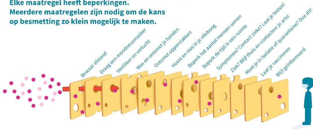
Gebaseerd op 'The Swiss cheese model of accident causation'; door James T. Reason, 1990.

Elke maatregel heeft beperkingen. Meerdere maatregelen zijn nodig om de kans op besmetting zo klein mogelijk te maken.