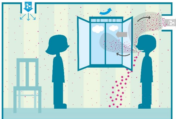
Mechanische ventilatie met aanvullend verluchting

Meer informatie over de verschillende ventilatiesystemen vind je teug onder titel 3. wat is ventileren en verluchten? .